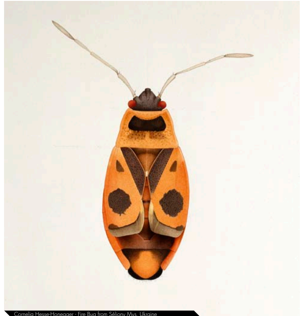
Cornelia Hesse-Honegger - Fire Bug from Séljony Mys, Ukraine