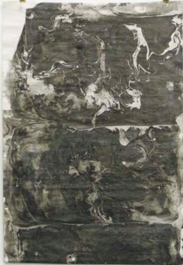
Erlea Maneros Zabala - Serie I