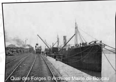
Quai des Forges